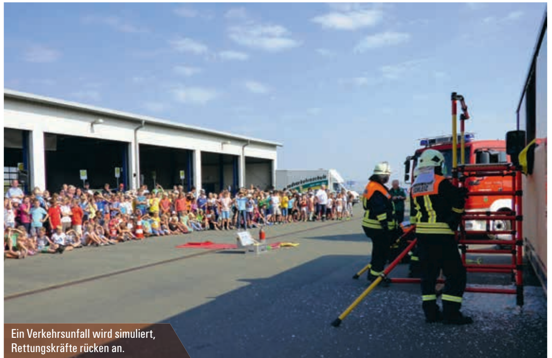
Ein Verkehrsunfall wird simuliert, Rettungskräfte rücken an.