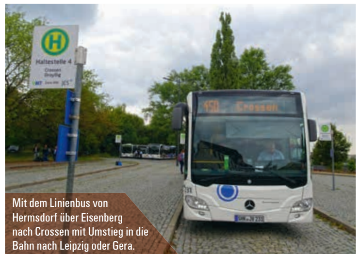
Mit dem Linienbus von Hermsdorf über Eisenberg nach Crossen mit Umstieg in die Bahn nach Leipzig oder Gera.

» Im Hauptlinien- netz der JES fahren die Busse jede Stunde dieselbe Runde.«