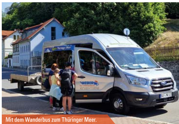
Mit dem Wanderbus zum Thüringer Meer.

»Das beliebte und bekannte Angebot bleibt 2023 stabil.«