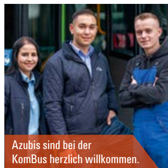
Azubis sind bei der KomBus herzlich willkommen.

Die KomBus benötigt in den kommenden Jahren gut ausgebildete und qualifizierte Fachkräfte. Der Weg dahin führt über eine Berufsausbildung für Schulabgänger und eine Qualifikation für Quereinsteiger, zum Beispiel LKW-Fahrer.