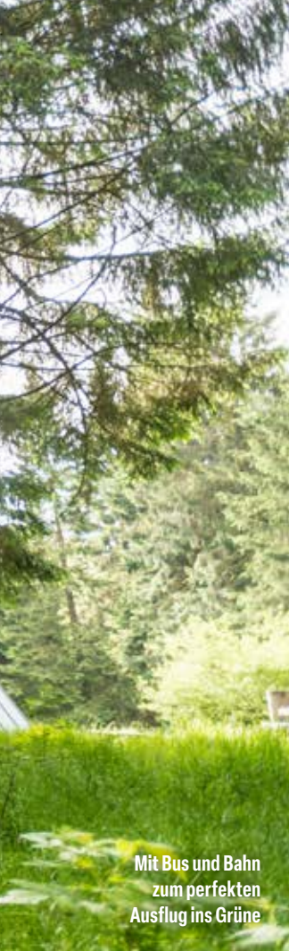
Mit Bus und Bahn zum perfekten Ausflug ins Grüne